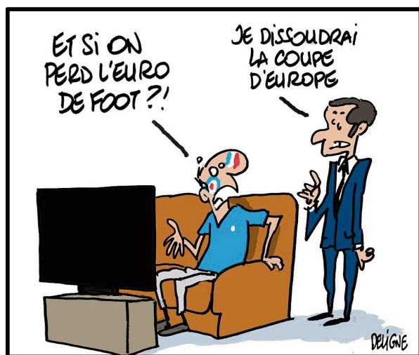
LA FRANCE TOUJOURS QUALIFIÉE EN COUPE D'EUROPE DE FOOT